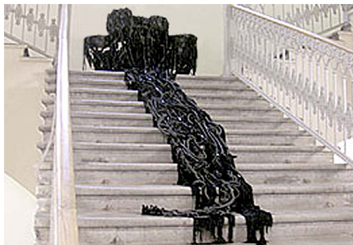
Теренс Коу «Все эти десятилетия без сна. Черные барабаны, 2004».

Этот текст не просто разрушал тревожное, напряженное состояние зрителя — он перечеркивал иные возможные интерпретации. Вместо раздумий о глубинах Бытия (или Небытия?), о Тьме порождающей (или поглощающей?), о непостижимой